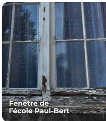
Fenêtre de l'école Paul-Bert