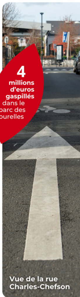
Vue de la rue Charles-Chefson

4 millions d'euros gaspillés dans le parc des Tourelles